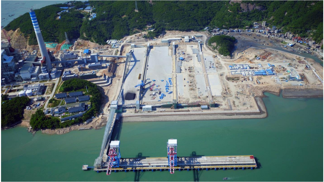
图为已竣工的华能福州港罗源湾港区将军帽作业区一期工程同竣工图片